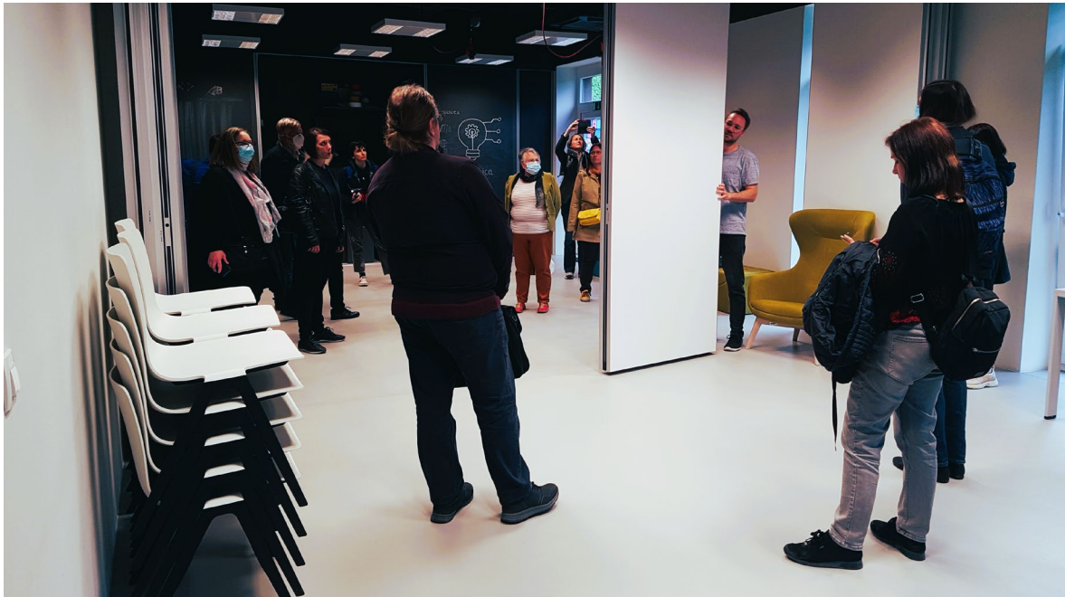
Slika 6: Kreativnica

Poseben prostor v Knjižnici Polje se imenuje Kreativnica. Gre pravzaprav za dva prostora: študijsko čitalnico in kreativnico, ki sta ločeni z zložljivo predelno steno. Kadar potrebujejo večji prostor, predelno steno v nekaj sekundah zložijo, kadar pa je dovolj manjši prostor, pa ga razdelijo v bolj intimna dva prostora. Prostor je zasnovan zelo praktično, npr. kar iz stropa visijo premikajoči kabli z vtičnicami, da se lažje uporabljajo glede na potrebo in nato hitro pospravijo. Druga zanimivost je omara z drsnimi vrati, ki je hkrati tudi tabla za pisanje. V Kreativnici imajo poleg dveh 3D tiskalnikov tudi druge uporabne stroje in pripomočke, npr. vbodno žago, dremel, spajkalno postajo, akumulatorski vrtalnik in šivalni stroj. Vse te pripomočke uporabljajo tekom dejavnosti, ki jih izvajajo, npr. zelo dobro so obiskane delavnice šivanja, računalniške in programerske delavnice, tečaji 3D tiskanja. Največ dejavnosti je namenjenih mlajšim uporabnikom. Delavnice večinoma izvajajo zaposleni, tudi vodja knjižnice, za kar so na različne načine, samoiniciativno, pridobivali dodatna potrebna znanja in spretnosti. Udeleženci strokovnega obiska smo se lahko prepričali o srčnosti, ki se čuti pri njihovem delu.