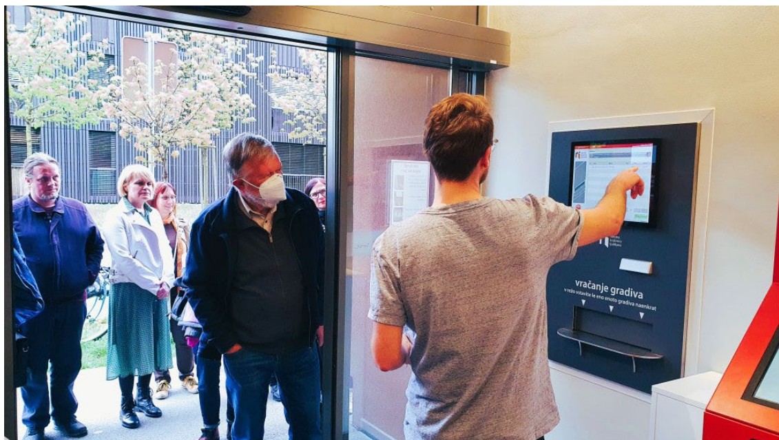
Slika 5: Vračalnik knjig

Poleg knjižnice je večji prostor za prireditve, opremljen z vrhunsko tehnologijo, ki si ga delijo z lokalno skupnostjo. Zaradi epidemioloških razmer ta prostor sicer še ni v rabi, uporabljajo pa zunanjo teraso, ki povezuje knjižnico in prireditveni prostor. Zunanja terasa je primerna za projekt »Knjižnica pod krošnjami« in določene delavnice za ustvarjanje. Uporabniki si lahko gradivo izposojajo in vračajo na knjigomatih, ali pa za pomoč prosijo informatorja, knjižničarja. Vsako lahko vrne knjige tudi v času, ko je knjižnica zaprta (24 ur na dan, vse dni v tednu). To so uredili tako, da se zunanja vrata knjižnice odprejo ob skeniranju črtna kode knjižne nalepke. Obiskovalec nato knjige vrne skozi zato namenjeno režo v vračalnik knjig. Ker smo člani DBL seveda sami knjižničarji, smo dobili privilegij, da smo si lahko ogledali tudi »zakulisje« tega vračalnika knjig. Ta namreč vsako knjigo skenira in razvrsti v enega izmed treh vozov, ki so stojijo poleg (posebej: knjige Knjižnice Polje; rezervirane knjige; knjige, ki so last drugih enot Mestne knjižnice Ljubljana).