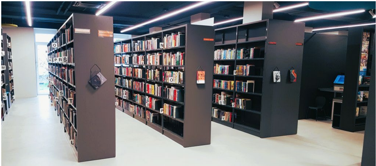
Slika 4: Nove police v Knjižnici Polje

Poleg knjižnice je večji prostor za prireditve, opremljen z vrhunsko tehnologijo, ki si ga delijo z lokalno skupnostjo. Zaradi epidemioloških razmer ta prostor sicer še ni v rabi, uporabljajo pa zunanjo teraso, ki povezuje knjižnico in prireditveni prostor. Zunanja terasa je primerna za projekt »Knjižnica pod krošnjami« in določene delavnice za ustvarjanje. Uporabniki si lahko gradivo izposojajo in vračajo na knjigomatih, ali pa za pomoč prosijo informatorja, knjižničarja. Vsako lahko vrne knjige tudi v času, ko je knjižnica zaprta (24 ur na dan, vse dni v tednu). To so uredili tako, da se zunanja vrata knjižnice odprejo ob skeniranju črtna kode knjižne nalepke. Obiskovalec nato knjige vrne skozi zato namenjeno režo v vračalnik knjig. Ker smo člani DBL seveda sami knjižničarji, smo dobili privilegij, da smo si lahko ogledali tudi »zakulisje« tega vračalnika knjig. Ta namreč vsako knjigo skenira in razvrsti v enega izmed treh vozov, ki so stojijo poleg (posebej: knjige Knjižnice Polje; rezervirane knjige; knjige, ki so last drugih enot Mestne knjižnice Ljubljana).