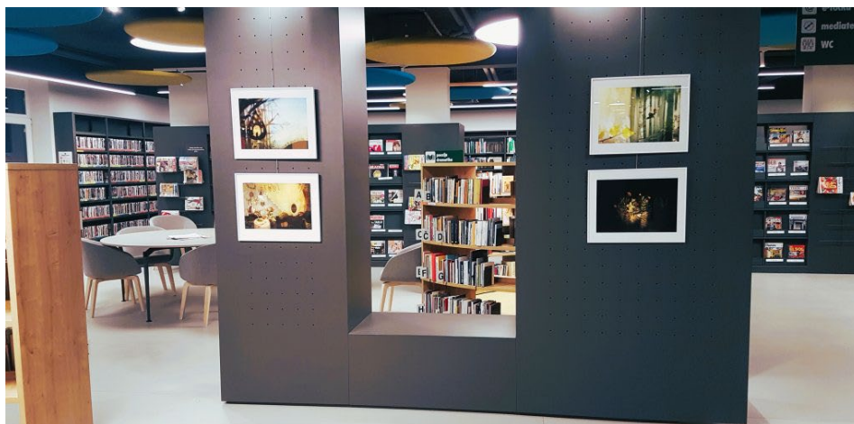
Slika 3: "Bitja iz pravljic" na stenah knjižnice

Nato smo se zbrali v osrednjem delu, kjer se nam je pridružila ilustratorka ga. Zarja Menart, ki nas je popeljala po krajši razstavi svojih likovnih upodobitev bitij iz pravljic. Ga. Zarja je avtorica mnogih ilustracij za otroške knjige, med drugim je upodobila več naslovnih za revijo Zmajček. Pri svojem delu kombinira različne tehnike risanja in animacije. Razložila nam je posebno tehniko ustvarjanja, s katero so nastale njene upodobitve bitij iz pravljic. Medtem smo radovedno občudovali svaritve, ki so bile umeščene na stenah med knjižnimi policami.