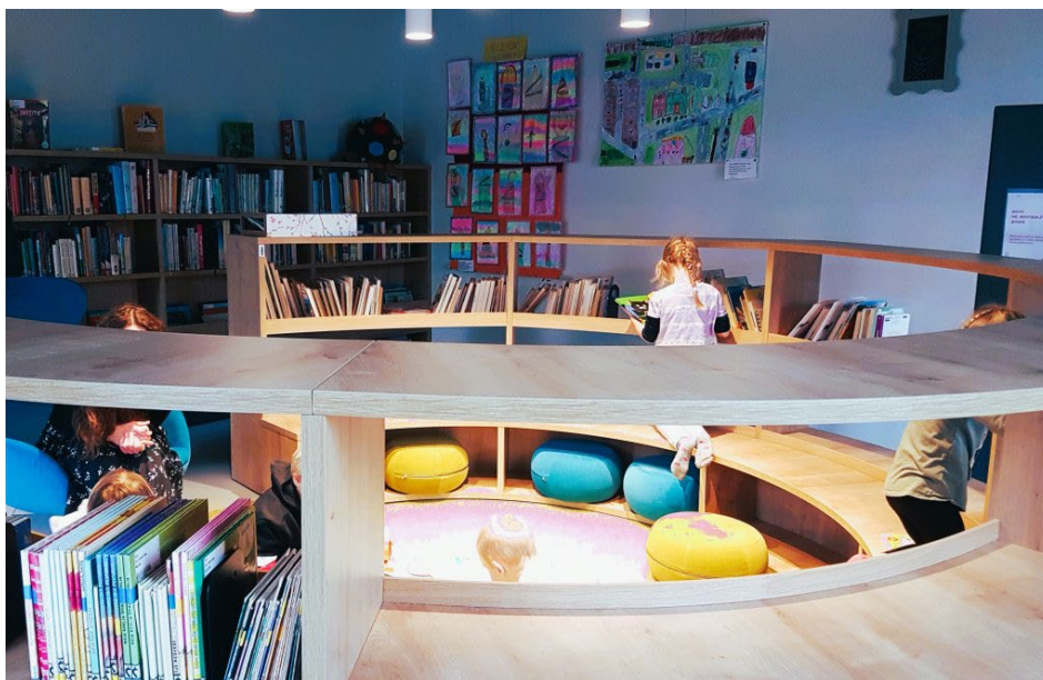
Slika 2: Otroški oddelek

Nato smo se zbrali v osrednjem delu, kjer se nam je pridružila ilustratorka ga. Zarja Menart, ki nas je popeljala po krajši razstavi svojih likovnih upodobitev bitij iz pravljic. Ga. Zarja je avtorica mnogih ilustracij za otroške knjige, med drugim je upodobila več naslovnih za revijo Zmajček. Pri svojem delu kombinira različne tehnike risanja in animacije. Razložila nam je posebno tehniko ustvarjanja, s katero so nastale njene upodobitve bitij iz pravljic. Medtem smo radovedno občudovali svaritve, ki so bile umeščene na stenah med knjižnimi policami.